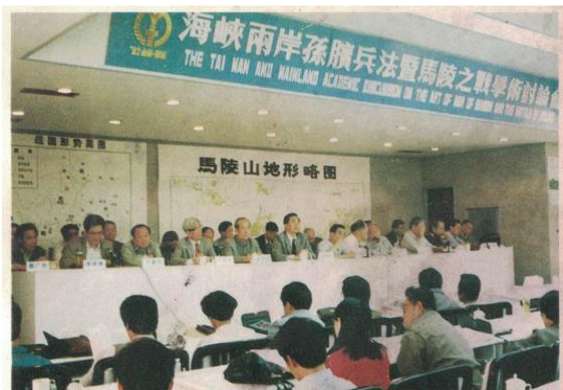
海峽兩岸孫臏兵法暨馬陵之戰學術研討會於1992年9月19日至21日在山東臨沂召開。圖為大會主席台

载：“齐伐魏，孙子胜庞涓于此”。1972年临沂银雀山汉墓竹简出土《孙臆兵法》，其《孙臆兵法·陈忌问垒》篇中提到五